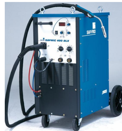
Tableau de réglage de la tension